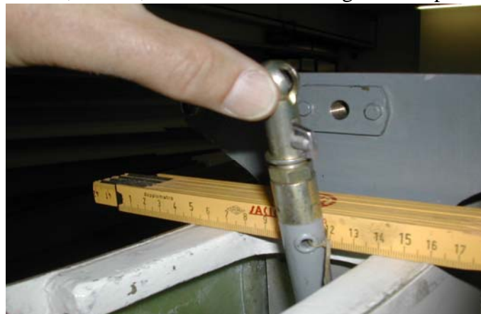
Si misura un particolare

Rilievo, misure, documentazione fotografica di particolari.