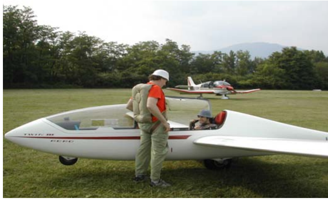
Pronti al decollo!