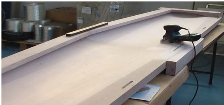
Lo stampo del ventre del piano di coda orizzontale