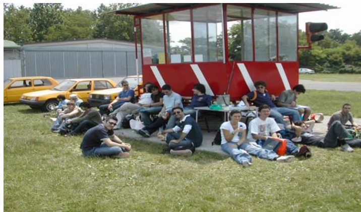
( o in pausa pranzo?)

- considerazioni specifiche sull'organizzazione del lavoro comune.