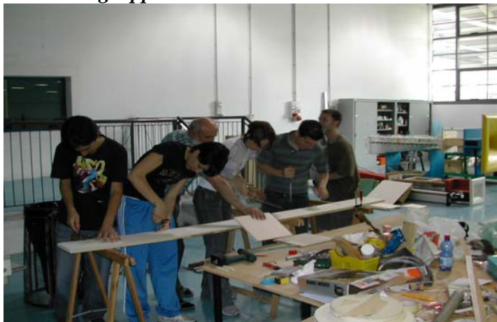
11 luglio 2005 - "lavoro di gruppo!"